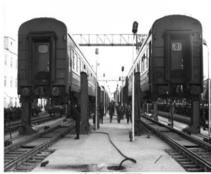
Trenuri în gara Ungheni, 22.06.76. Sursa: Agenția Națională a Arhivelor, fototeca, c.a. 3721.