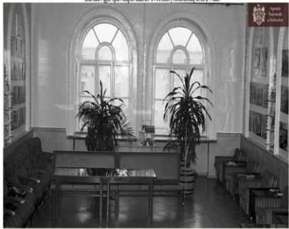
Aspectul interior al sălii de așteptare pentru oaspeții de peste hotare a gării Ungheni, anul 1981.