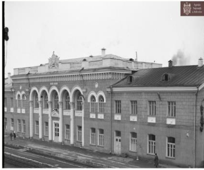
Aspectul fațadei clădirii gării Ungheni, anul 1981.