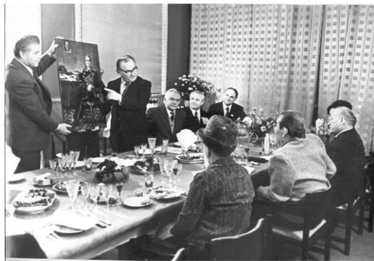
Vizite și treceri ale liderilor comuniști prin gara Ungheni în anii sovietici: 1. T. Jivcov - Bulgaria, 2. L. Brejnev - URSS, 3. Kim Ir-Sen - Coreia de Nord.